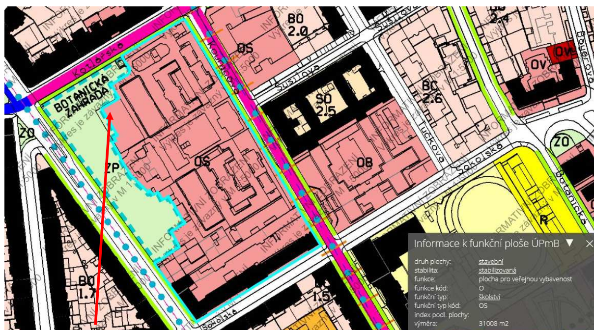
- výřez ÚPmB (objekt)

Nenachází se v záplavovém území a území ohroženém důlní činností a seizmickou aktivitou.